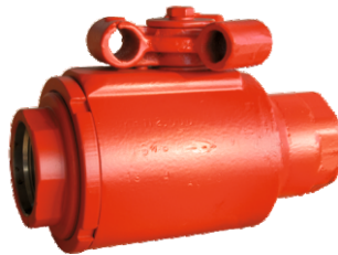
СИН112.000 СИН114.000 СИН120.000